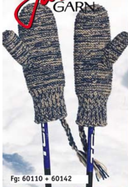
Fg: 60110 + 60142