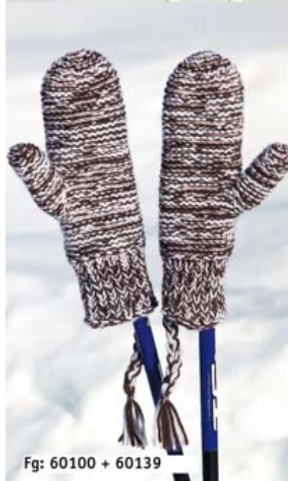
Fg: 60100 + 60139