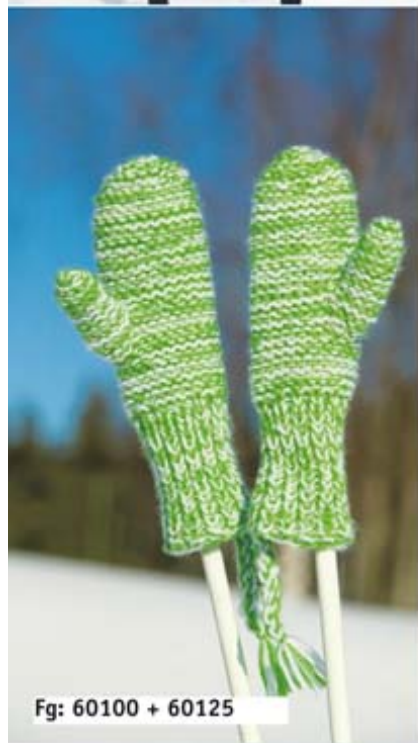
Fg: 60100 + 60125