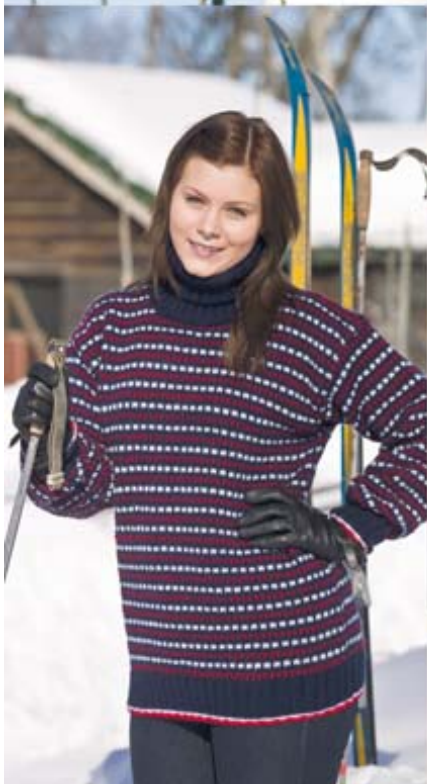
FUGA TELEMARKSTRÖJA TILL HENNE STORLEKAR: S-2XL