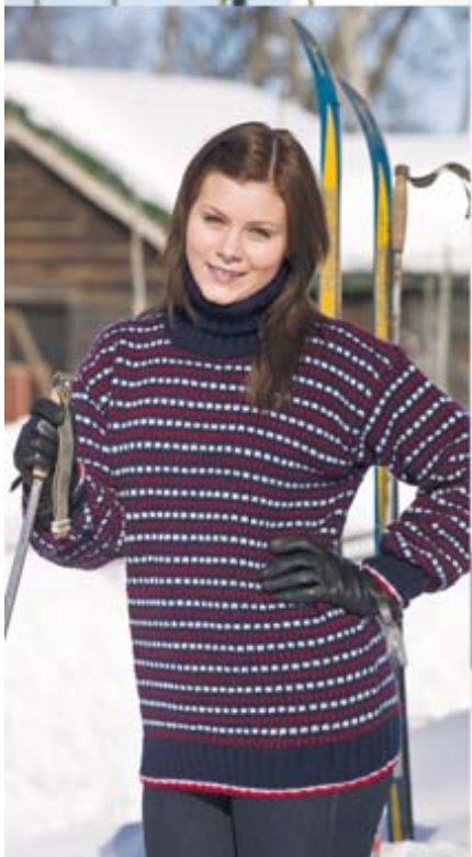
FUGA TELEMARKSTRÖJA TILL HENNE STORLEKAR: S-2XL