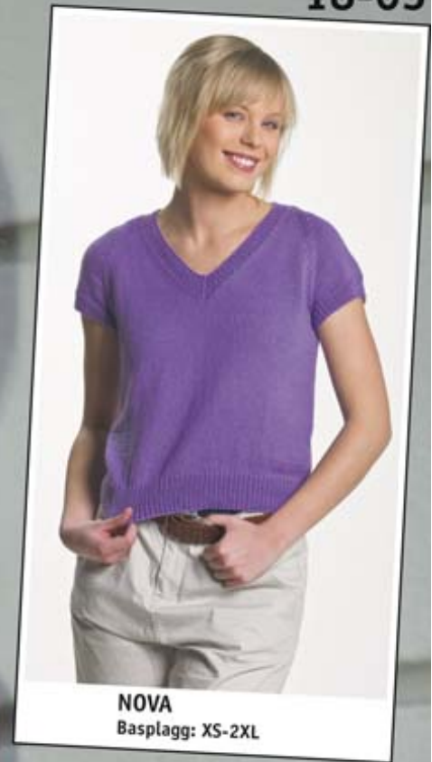
NOVA Basplagg: XS-2XL