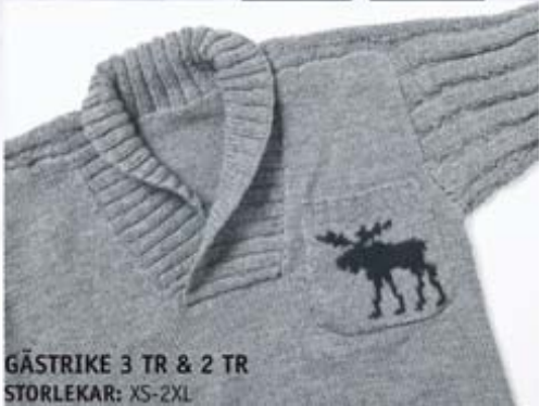
GÄSTRIKE 3 TR & 2 TR STORLEKAR: XS-2XL