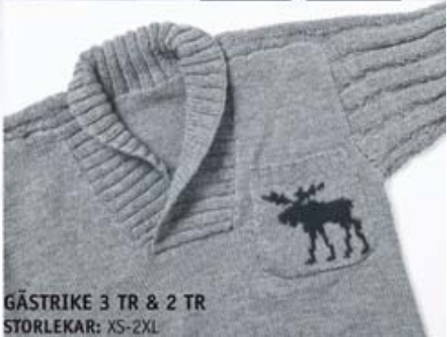
GÄSTRIKE 3 TR & 2 TR STORLEKAR: XS-2XL